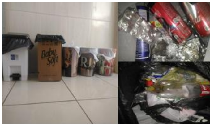
Figura 1 – Material triado.

A determinação da composição gravimétrica dos RSD foi obtida relacionando a fração total de cada categoria após a separação em relação à massa total das amostras coletadas em cada setor, de acordo equação 1: